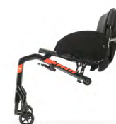
DKA1500 a DKA1540