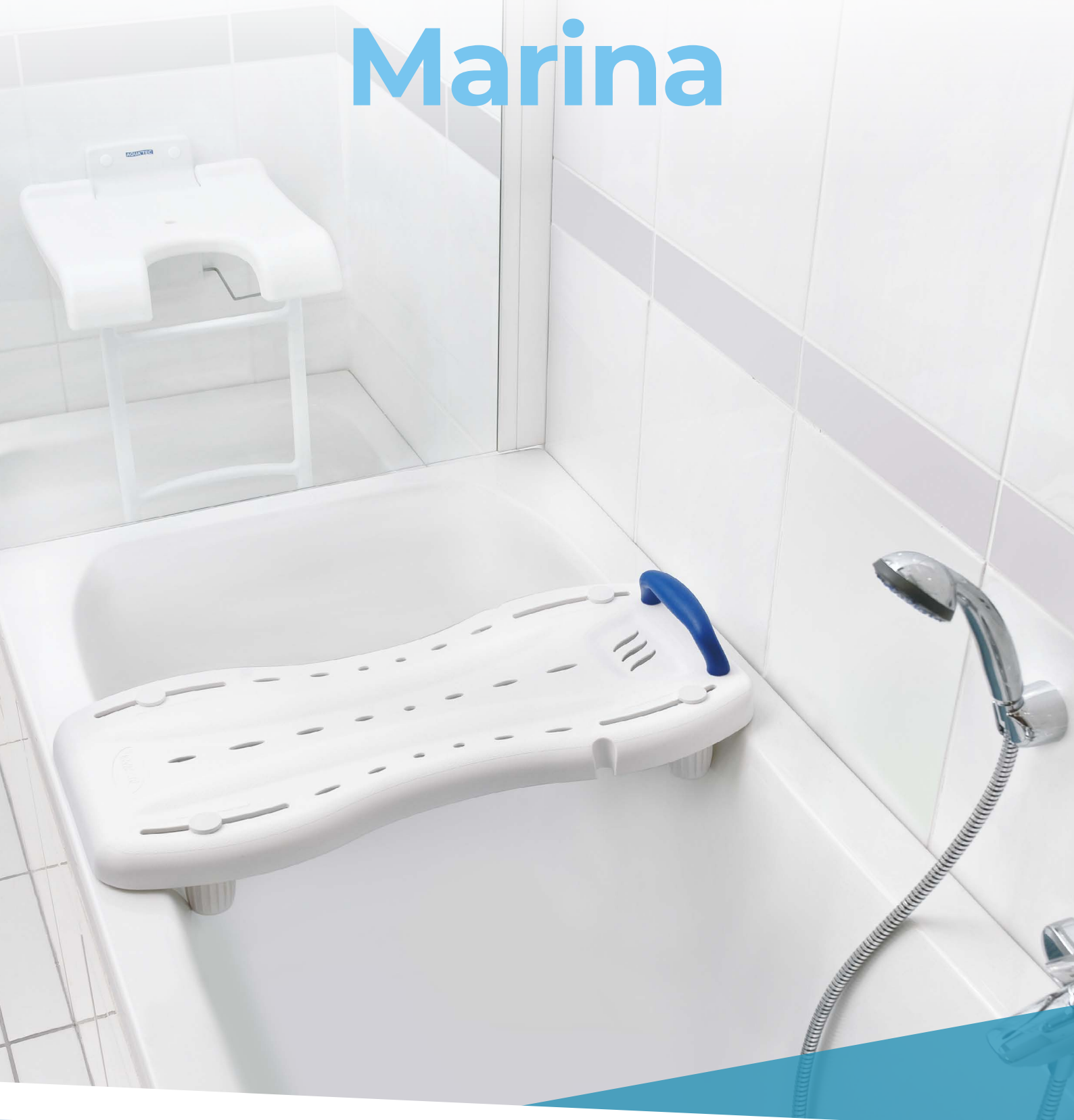
Tabla de bañera cómoda y segura